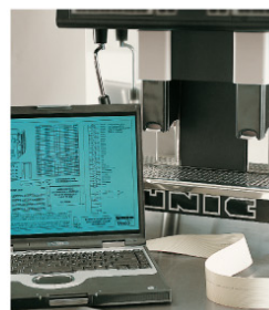
Connexion informatique Computer interface