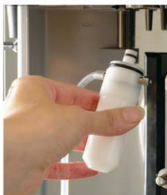
Système cappuccinateur Cappuccinatore device