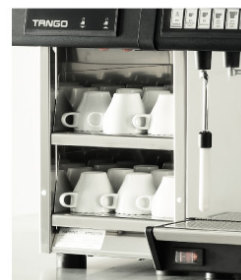
Module Chauffe-tasses Cup Warmer Module