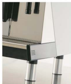
Pieds hauts Raised feet