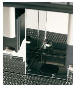
Evacuation directe du marc Coffee grounds direct chute discharge