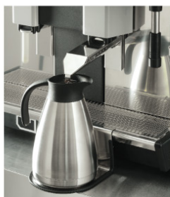
Service hôtel/déjeuner Hotel/breakfast service system