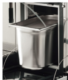
Module Cappuccino Cappuccino Module