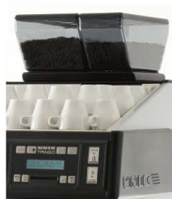
Deuxième moulin Second grinder