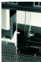
Evacuation directe du marc Coffee grounds direct chute discharge