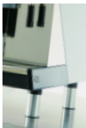
Pieds hauts Raised feet