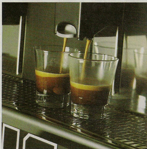
42 | TOP Entreprises | Équipements